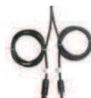
1,5m. de cable con conexión MC4